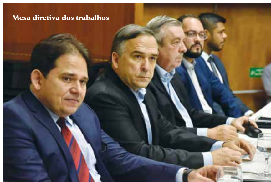
Mesa diretiva dos trabalhos

O presidente afirmou ainda que a reforma é “urgente e necessária”, e que a PEC 45 agrada como uma abertura de discussão do tema, mas que o empresariado diverge de alguns pontos