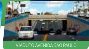
VIADUTO AVENIDA SÃO PAULO