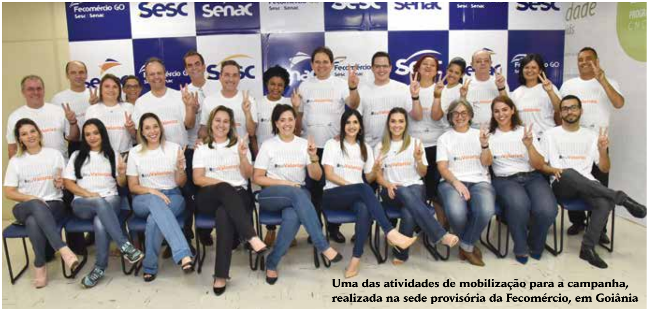
Uma das atividades de mobilização para a campanha, realizada na sede provisória da Fecomércio, em Goiânia

panha, mesma ação desenvolvida na reunião de diretoria de todo Sistema em Goiás, no dia 26 de outubro. Na mesma data foi solicitado a todos os 31 sindicatos da Fecomércio que divulguem a campanha entre seus associados.