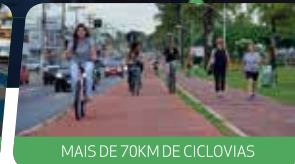
MAIS DE 70KM DE CICLOVIAS