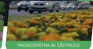
PAISAGISMO NA AV. SÃO PAULO