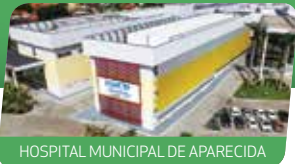
HOSPITAL MUNICIPAL DE APARECIDA