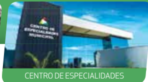
CENTRO DE ESPECIALIDADES