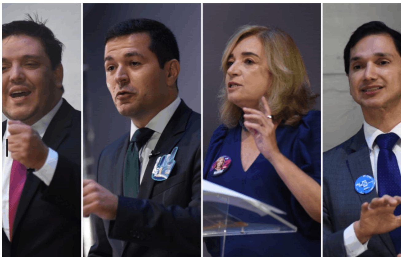
Fecomércio recebeu os candidatos anteriormente para apresentarem suas propostas