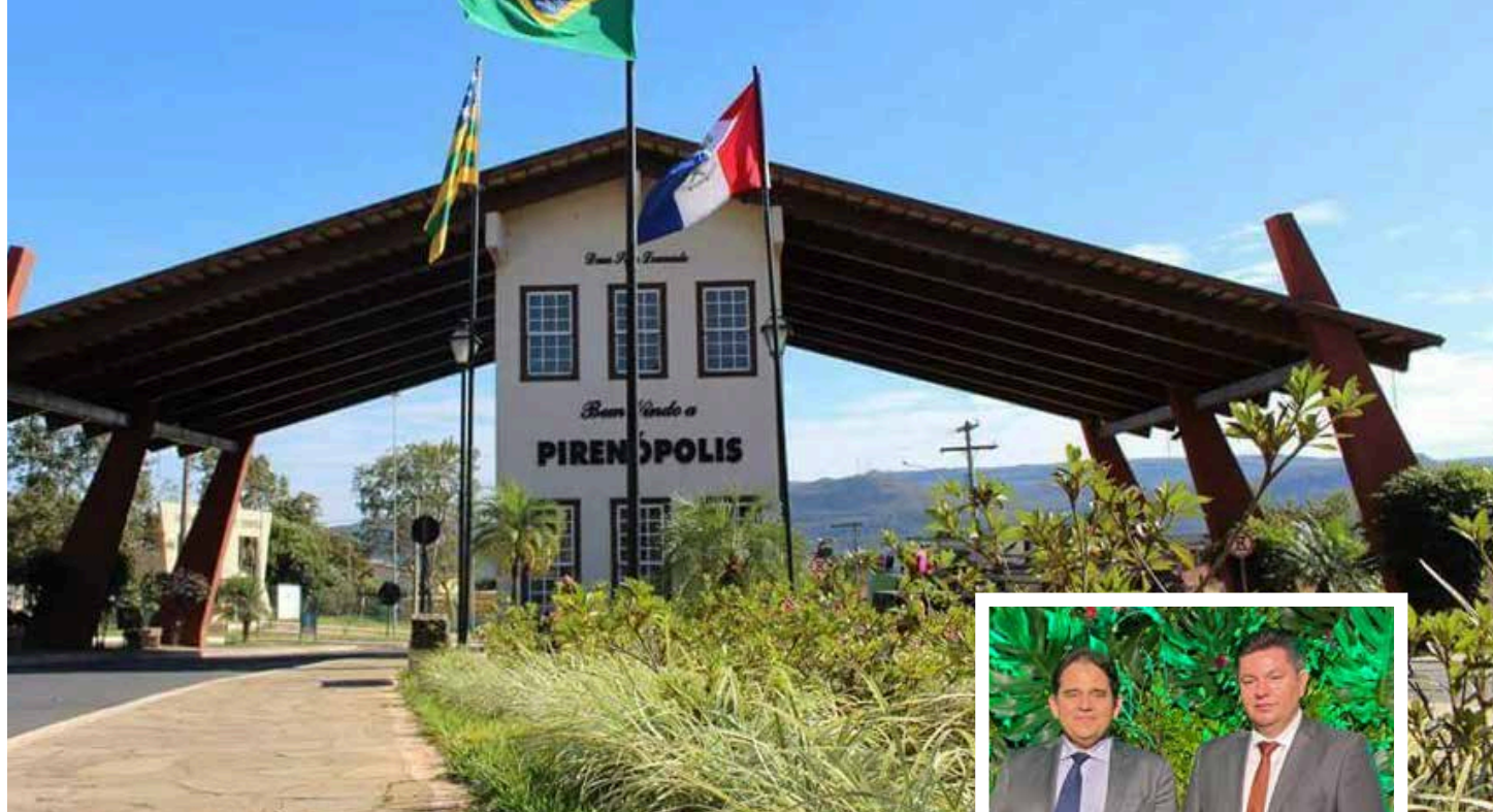
PREFEITURA DE PIRENÓPOLIS