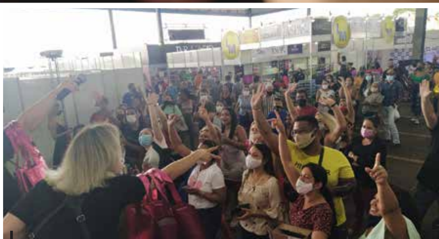
Trindade recebe a próxima edição da Fegobel em novembro de 2022