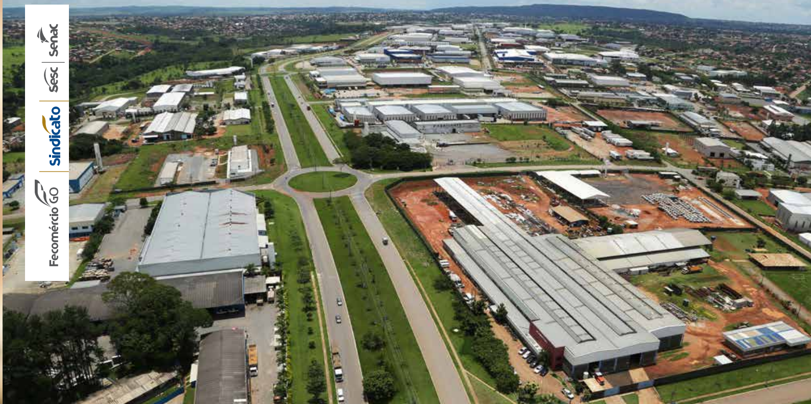
Prefeitura de Aparecida