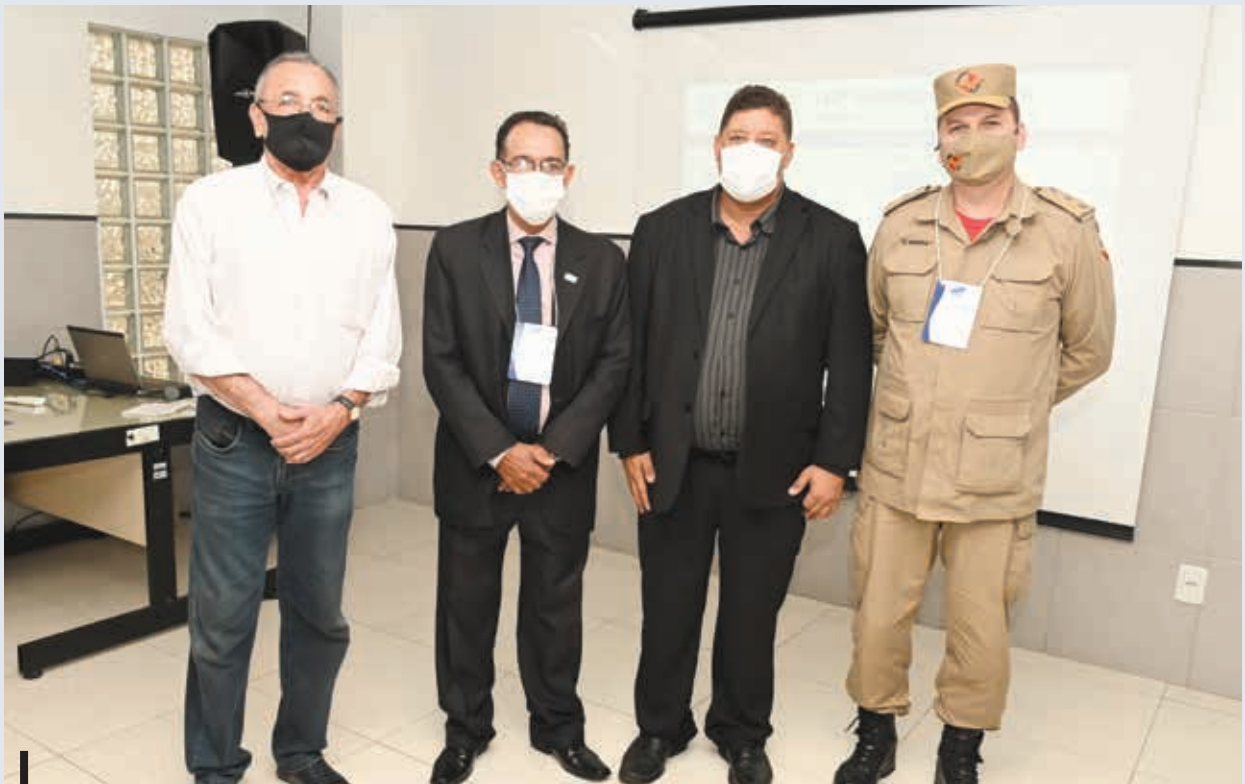
Evento abordou temas sobre a segurança e a eficiência na utilização dos gases combustíveis

Na ocasião, também foi apresentado um novo curso online e gratuito sobre a norma BBR 15514, que aborda a área de armazenamento de recipientes transportáveis para GLP. Voltado para revendedores, profissionais das distribuidoras, fiscais da Agência Nacional do Petróleo, Gás Natural e Biocombustíveis (ANP) e membros do Corpo de Bombeiros. O curso ficará disponível pelo período de um ano.