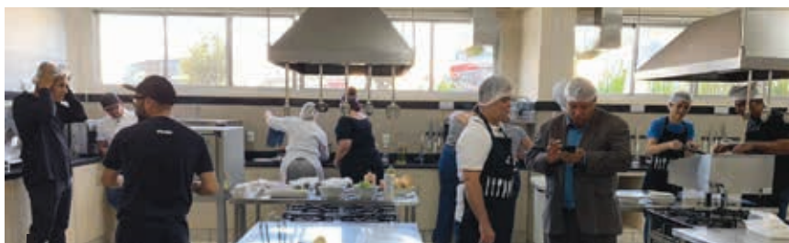
Evento contou com a participação de 6 pit-dogs

“O Sindipit-dog levou o pit-dog para um novo patamar, a questão de ser um patrimônio imaterial é uma conquista importante para nossa cidade e para nosso estado.