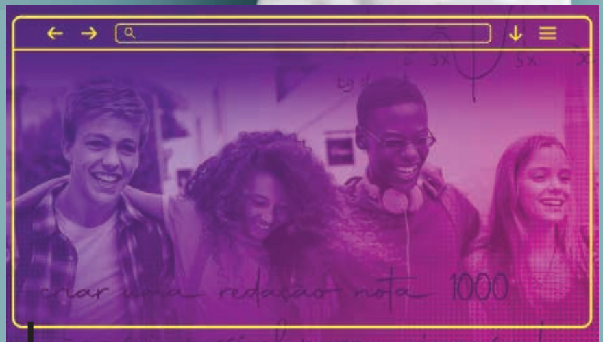
Aulas acontecerão de forma presencial nas unidades do Senac

Junto com o governo estadual, por meio da Secretaria da Educação (Seduc), e em parceria com o Instituto Carlos André, o Senac Goiás vai bene-