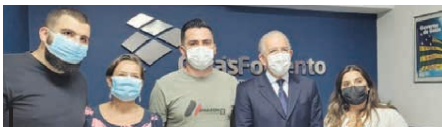
Nova conquista ajuda categoria principalmente na era pós pandêmica

De acordo com o presidente do Sindifeirantes, essa disponibilização não