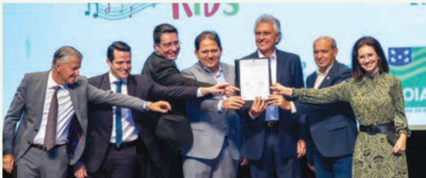
Assinatura dos convênios entre o Estado, prefeituras e Sesc Goiás

Direcionada ao público jovem, na faixa etária de 4 a 11 anos, a primeira edição do Concurso Canto da Primavera Kids será realizada de 22 a 26 de junho, numa parceria entre a Secult Goiás e a Prefeitura