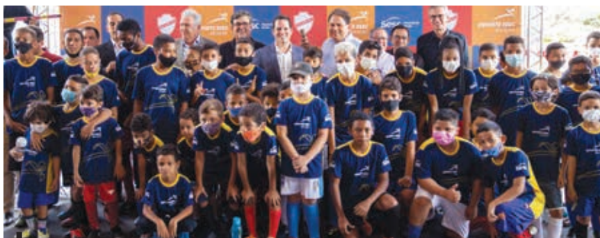
Projeto é gratuito e voltado a crianças de 4 a 16 anos

Além das modalidades esportivas, o Sesc oferecerá aos alunos matriculados no projeto atendimento Oftalmológico, por meio do programa Saúde Visão, e acesso à leitura através do BiblioSesc, possibilitando que os estudantes que tiverem a Credencial (cartão) Sesc atualizada façam o empréstimo de livros. As carretas