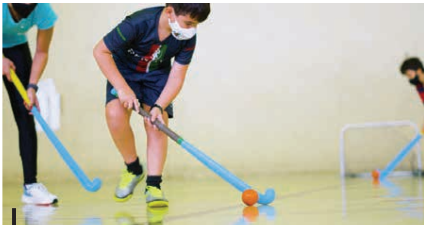
O esporte na infância estimula a interação social e promove o desenvolvimento locomotor

De acordo com a profissional, na primeira fase da infância, a criança é copista, ou seja, copia aquilo que tem dentro de casa. Por isso, os pais e responsáveis precisam dar o exemplo. Ela garante que pais que praticam atividades físicas, terão também filhos praticantes. Assim como pais que se