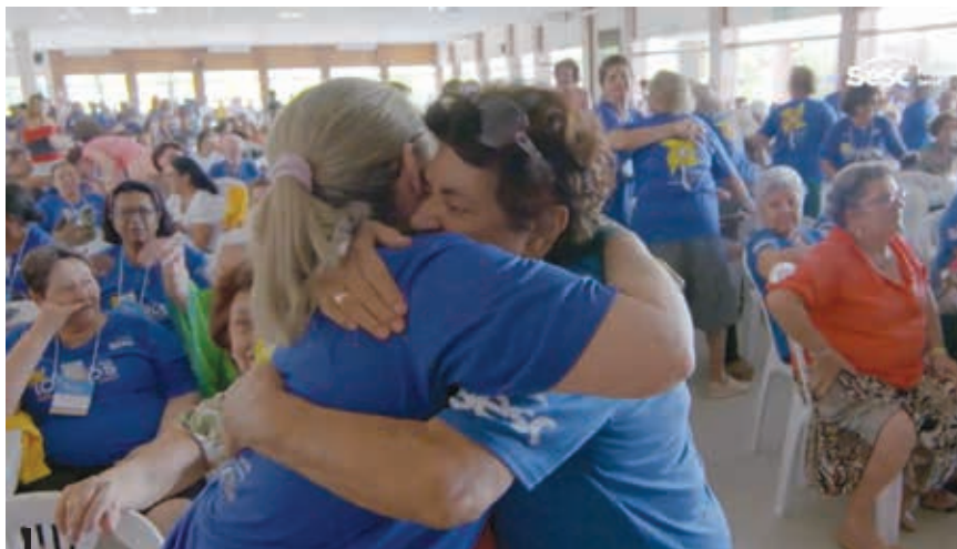
Trocas interpessoais são essenciais para o bem-estar

A manutenção dos relacionamentos familiares, sociais e afetivos, e as trocas interpessoais são essenciais para o bem-estar e a qualidade de vida de pessoas de todas as idades. A ausência do convívio social afeta as emoções, podendo causar