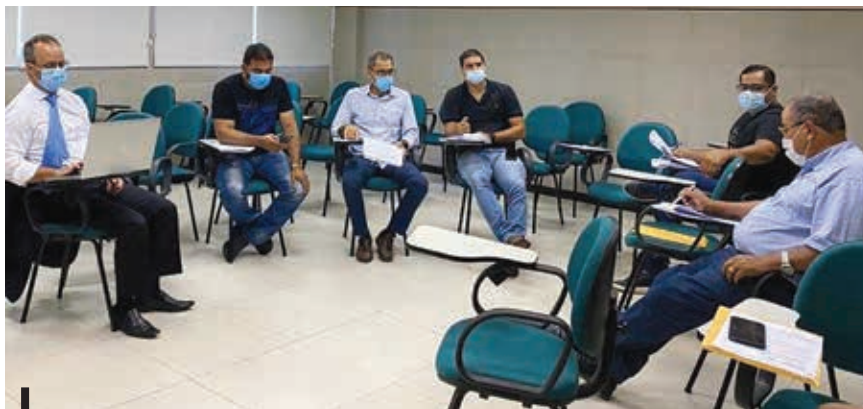
Segmento se reuniu diversas vezes para alinhar os anseios da categoria