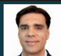
RAFAEL COIMBRA (MIT TECHNOLOGY REVIEW BRASIL)

PALESTRA: TENDÊNCIAS E IMPACTOS TECNOLÓGICOS NO COMÉRCIO E NO TURISMO