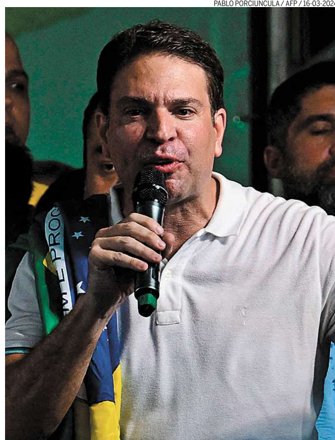
Aliança. Alexandre Ramagem, pré-candidato à prefeitura do Rio