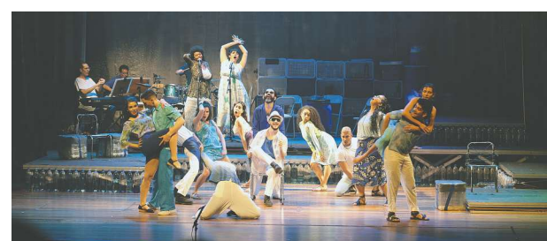
Alunos contam com estrutura moderna e teatro de 600 lugares

Após a conclusão do curso, os formandos têm acesso gratuito ao registro profissional emitido pela Delegacia Regional do Trabalho (DRT). Para se candidatar, é preciso ter mais de 18 anos e o ensino médio completo. As inscrições podem ser feitas de 8 de abril a 6 de maio, pelo site poloeducacionalsesc.com.br.