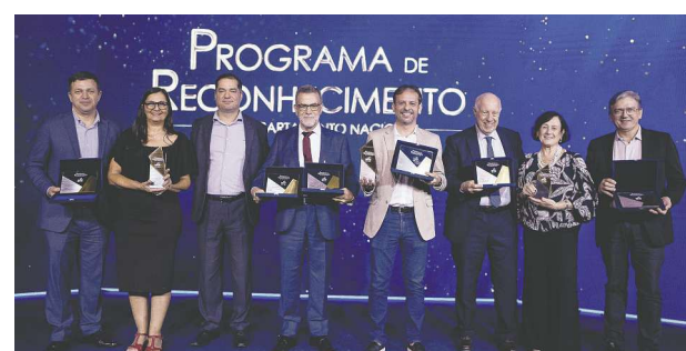
Cerimônia de premiação do programa foi no Rio de Janeiro

Os vencedores, por categoria, foram respectivamente: Impacta – 1º São Paulo, 2º Minas Gerais, 3º Goiás; Transforma – 1º Pará, 2º Minas Gerais, 3º Piauí; e Inova – 1º Rio Grande do Norte, 2º Rio de Janeiro, 3º Pernambuco.