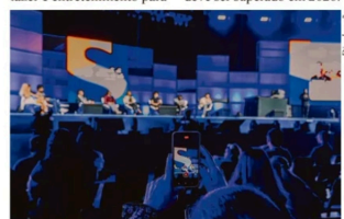
A primeira edição do evento reuniu mais de 1 milhão de pessoas

A Semana S oferece palestras, oportunidades de networking, serviços de saúde e bem-estar, oficinas práticas de capacitação, debates sobre tendências de mercado de uma programação cultural completa, com shows, lazer e entretenimento para