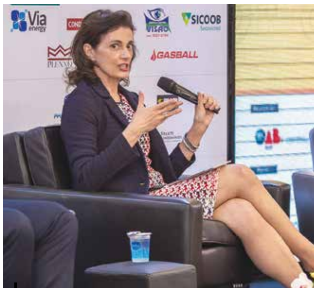
Palestra de encerramento do evento com a jornalista Lilian Witte Fibe

A jornalista Lilian Witte Fibe, com a palestra “A velocidade da recuperação - Brasil numa nova era de transformações rumo à retomada da atividade econômica”, encerrou o evento que possibilitou a síndicos e administradores de condomínios o compartilhamento e a troca de conhecimentos e experiências relevantes que, seguramente, resultarão na ampliação da qualidade das gestões condominiais em Goiás.