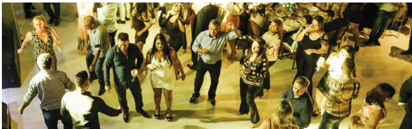
Evento celebrou o primeiro ano da atual gestão