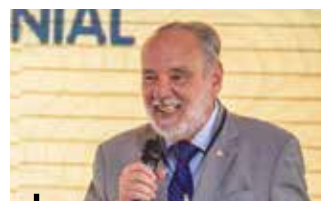
Desembargador Sylvio Capanema discorreu sobre pontos controversos na esfera condominial