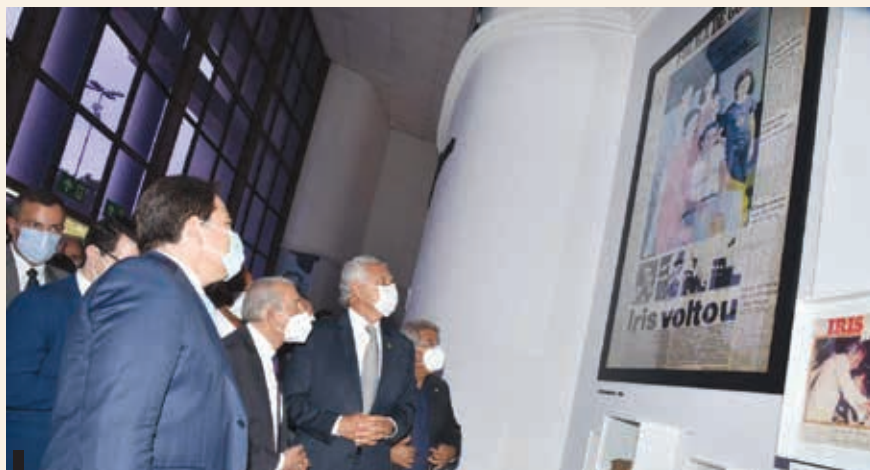
Inauguração da exposição permanente