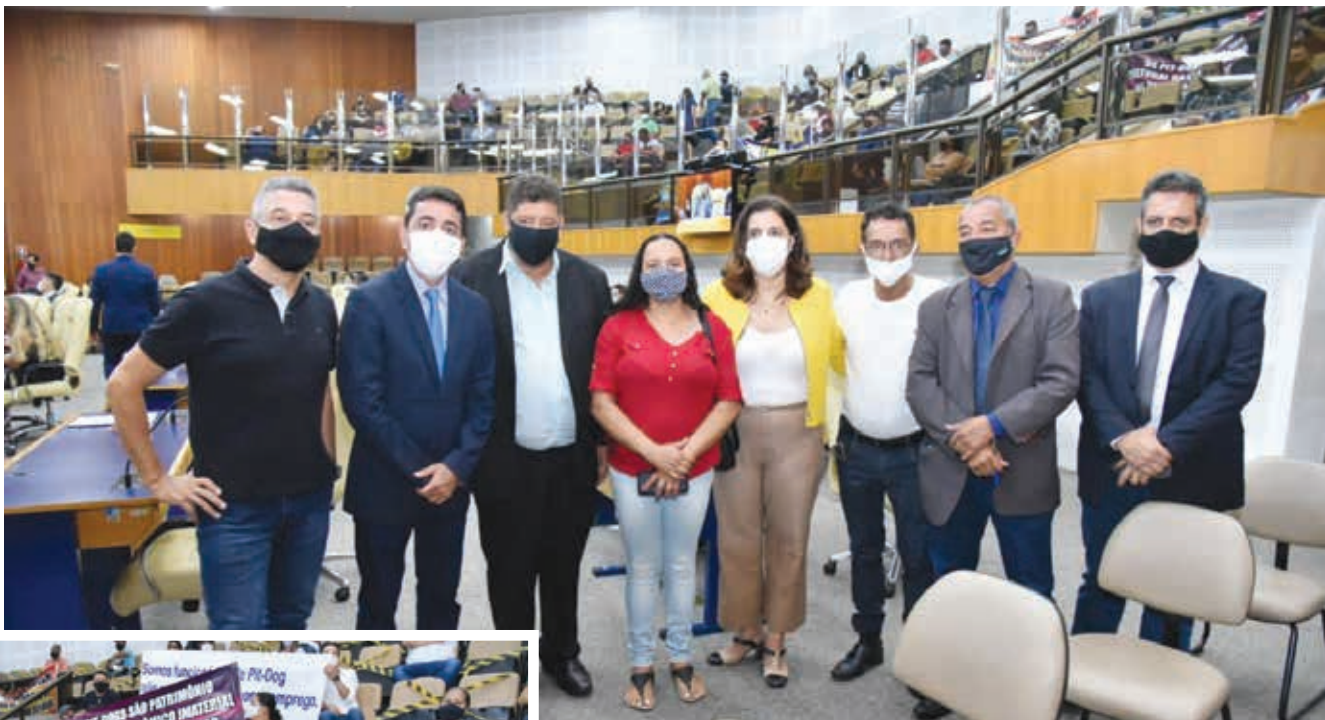
Empresários e trabalhadores de pit-dogs participaram presencialmente da votação na Câmara Municipal