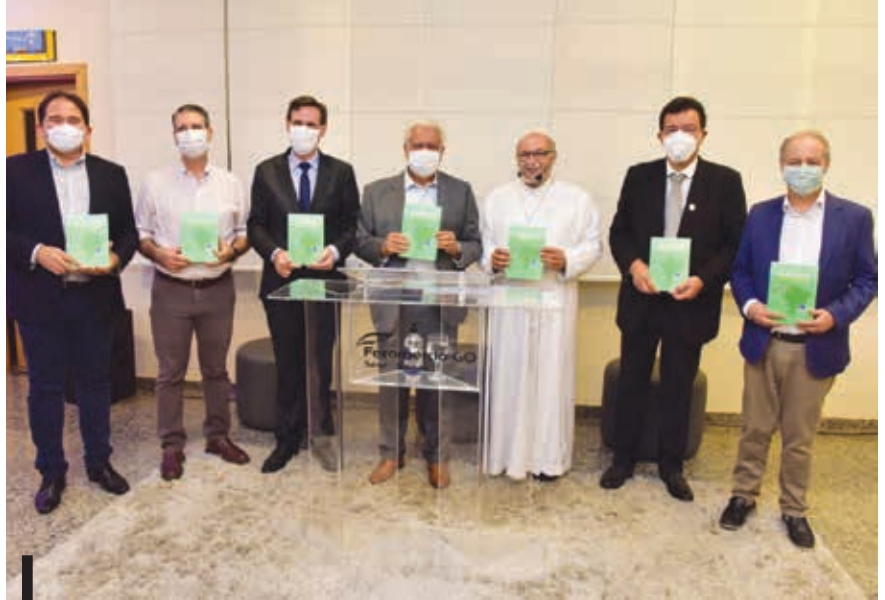
Lançamento nacional do livro “Brasil nos Anos 2020 – Desafios e Possibilidades”