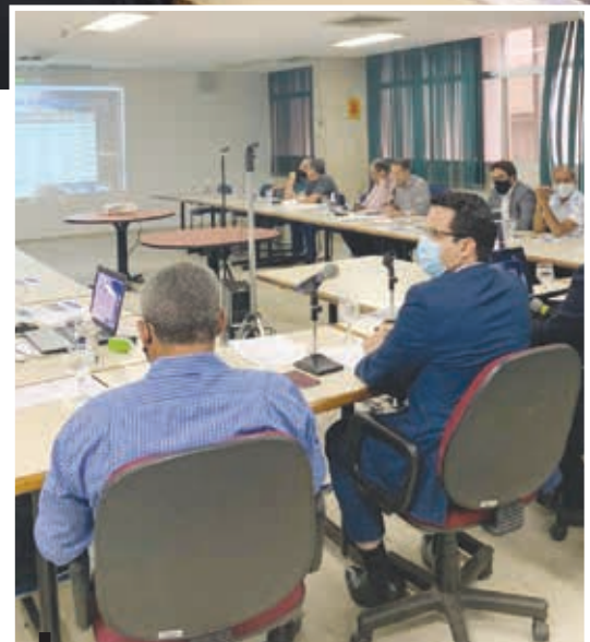
A reunião contou com vários diretores do Sistema Fecomércio de maneira presencial e também virtual

Ao responder a pergunta sobre o fim do auxílio emergencial e seus reflexos sobre o giro econômico, o vice-presidente da República afirmou entender que a construção de um pacote social “mais robusto” deve ser partilhada pelo Palácio do Planalto com o Congresso Nacional. “Essa é a pergunta que não quer calar (...) Governo tem que buscar essa solução junto ao Congresso, porque a peça orçamentária não tem espaço para que a gente consiga melhorar o social”, afirmou.