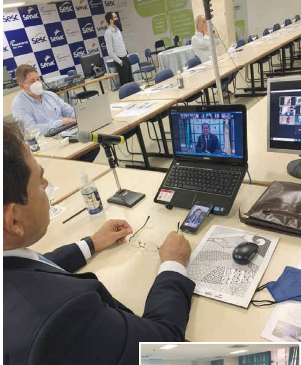
Reunião virtual com o vice-presidente da República: parceria com o Sistema S

O vice-presidente disse que a retomada econômica será prioridade total quando superada a pandemia de covid-19. Segundo Mourão, depois da campanha nacional de vacinação, a prioridade do Palácio do Planalto será a aprovação das reformas tributária e administrativa. Mourão afirmou ainda que, para isso, a articulação política do governo do presidente Jair Bolsonaro atuará com “clareza para apresentar os objetivos do governo, determinação para negociar e paciência para nego-