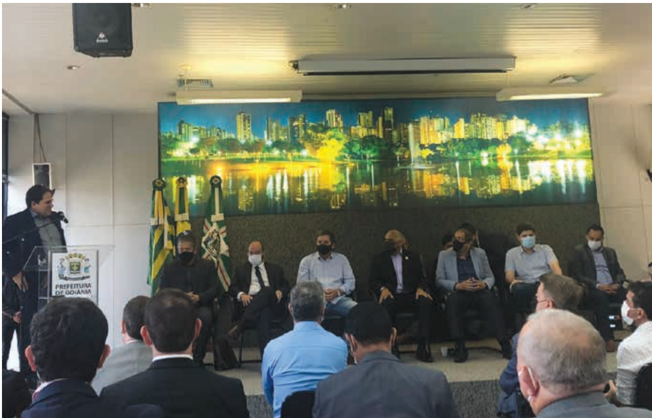
Após 46 anos, novo Código Tributário foi sancionado em setembro de 2021