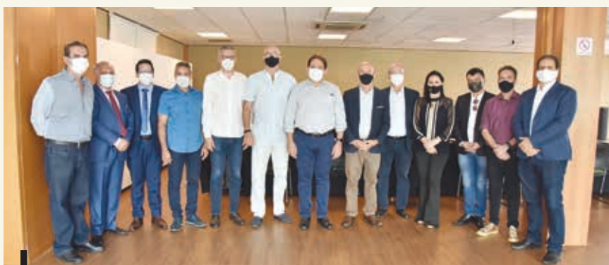
Equipe do Tocantins conheceu as inovações desenvolvidas pelo Sistema para a classe empresarial em Goiás