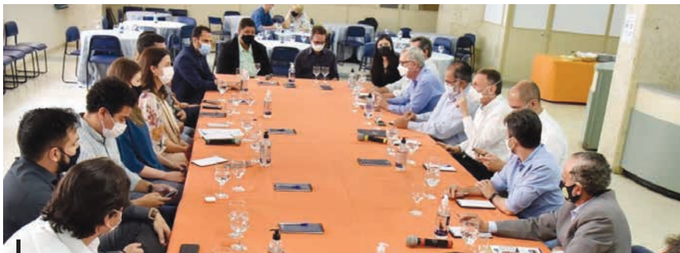
Para o presidente do Secovi-GO, trabalho entre os setores público e privado evita distorções do crescimento urbano