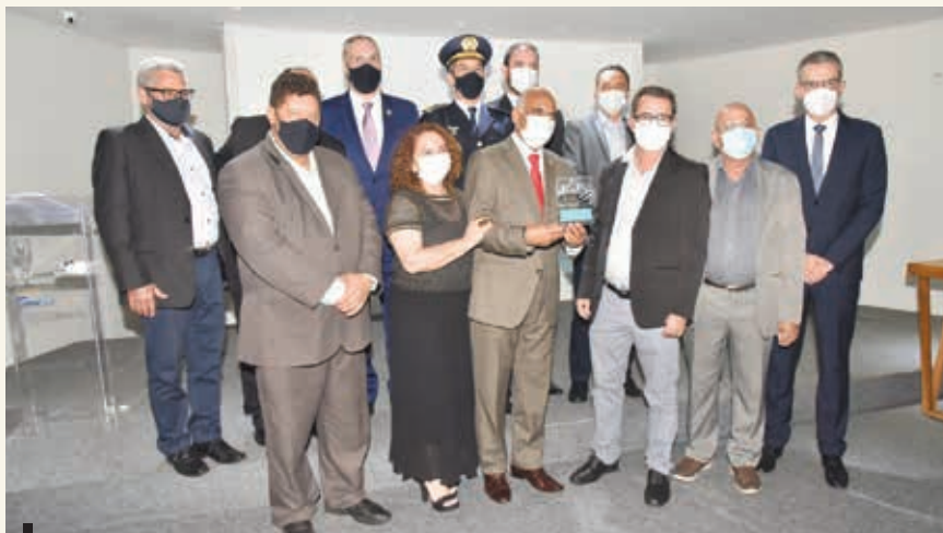
Prêmio homenageia personalidades que se destacam no Estado