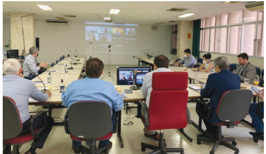
Reunião debateu o novo Código Tributário de Goiânia e Passaporte Municipal de Vacinação