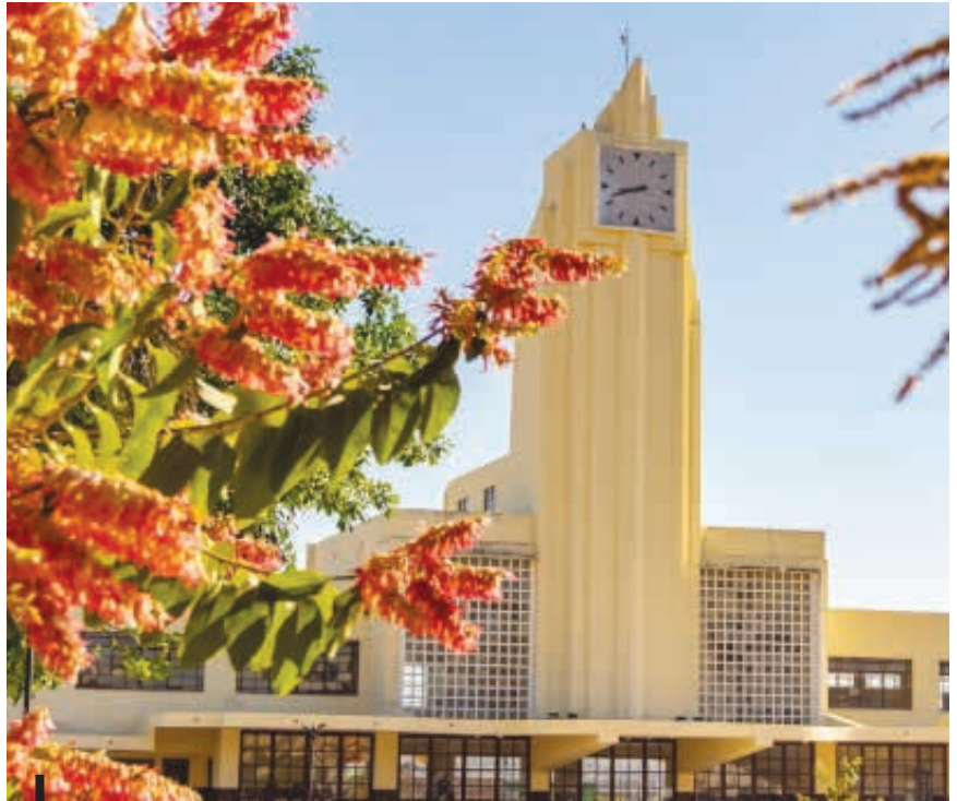
Exposição Simetria promoveu a conexão entre 21 mulheres e 21 prédios Art Déco tombados como patrimônio goiano

A exposição ficou disponível de 25 de outubro a 25 de novembro, no Saguão da antiga Estação Ferroviária de Goiânia. As fotos foram colocadas em biombos com formato inspirado nos traços da arquitetura Art Déco e as informações sobre os patrimônios e as convidadas nos prédios ícones foram impressos em laser no jeans, reforçando a importância da tecnologia na moda, em português e inglês, com tradução de Luís