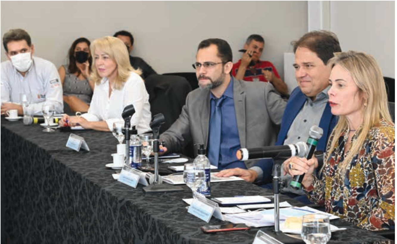
Secretária acredita que o setor privado é o que move os empregos e renda