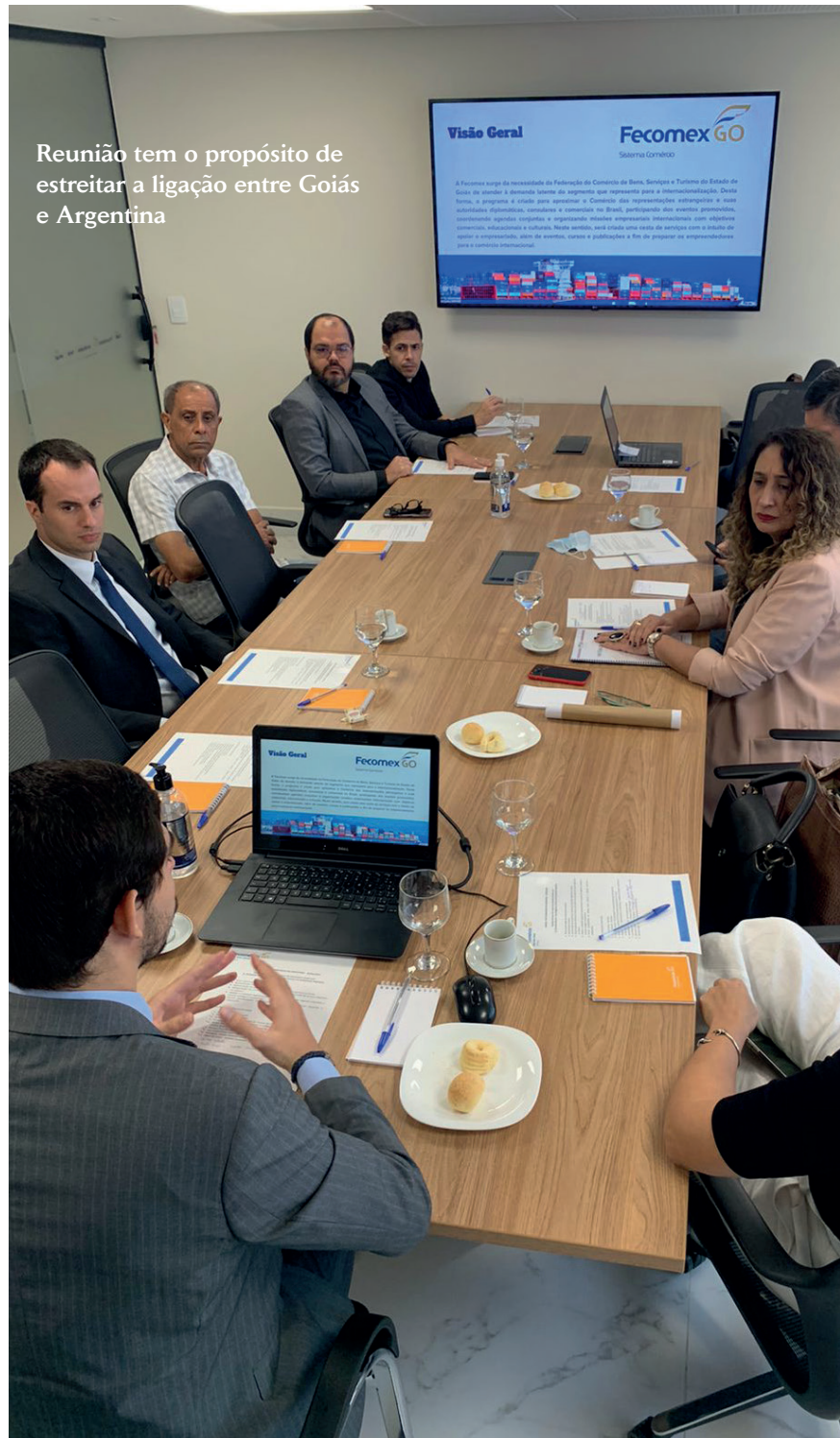
Reunião tem o propósito de estreitar a ligação entre Goiás e Argentina