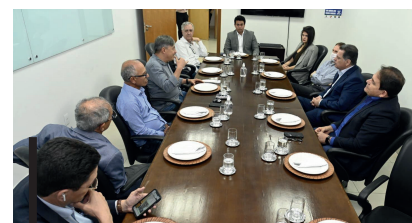
Reunião foi importante para ouvir as observações dos pré-candidatos sobre o cenário político atual