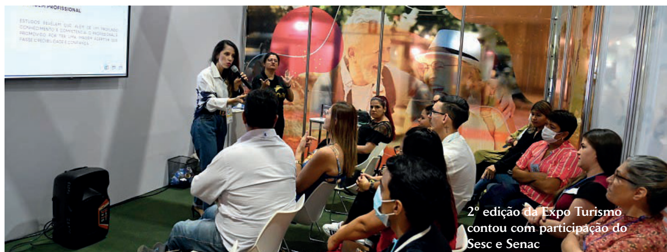
2ª edição da Expo Turismo contou com participação do Sesc e Senac

O Senac traz a qualificação profissional, que vai melhorando qualidade do serviço de turismo, e o Sesc presta serviços com excelência no turismo. Então é muito bacana a gente poder estar mais uma vez na feira, participando e trazendo toda essa qualidade o sistema S, Sesc e Senac possuem”, ponderou.