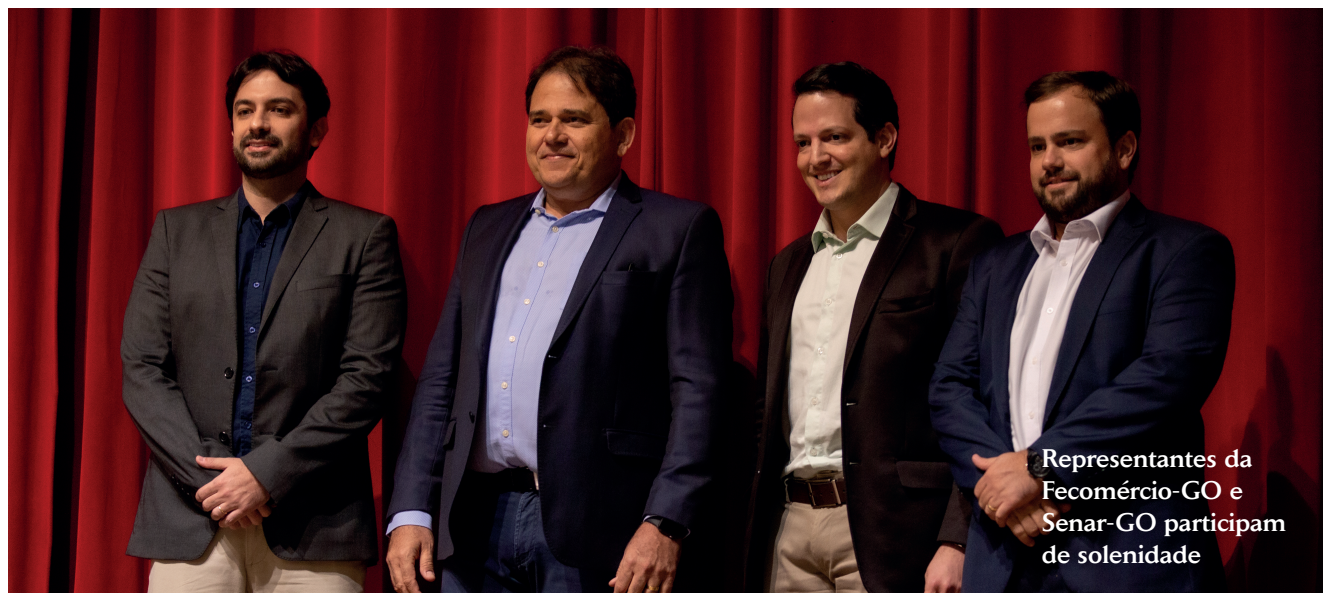
Representantes da Fecomércio-GO e Senar-GO participam de solenidade