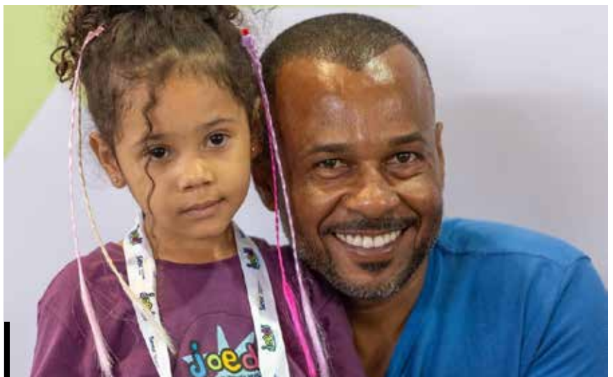
Em 2024, o Joedi foi realizado sob o tema “valores esportivos”