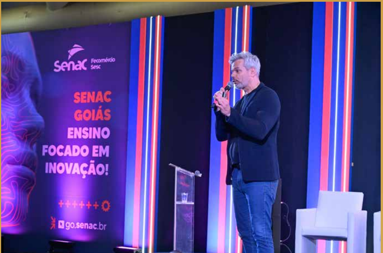
Apresentador, comunicador e ator, Otaviano Costa em sua palestra “Desafios do século 21” na Expo Fecomércio

A mensagem de Otaviano foi relevante para o público da Expo Fecomércio que enfrenta um mercado cada vez mais dinâmico e competitivo. Sua palestra inspirou os presentes a buscarem novas maneiras de se reinventar profissionalmente, mostrando que a persistência e a comunicação são chaves fundamentais para o sucesso no século 21.