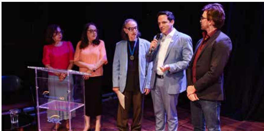
Miguel Jorge, escritor e expoente da literatura goiana foi o homenageado pelo Sesc Goiás nesta edição do evento

Para o diretor regional do Sesc e Senac Goiás, Leopoldo Veiga Jardim, “o II Circuito Literário trouxe autores que tinham acabado de participar da 27. Bienal do Livro de São Paulo (de 6 a 15/9) e vieram interagir, conversar e autografar seus livros para os leitores