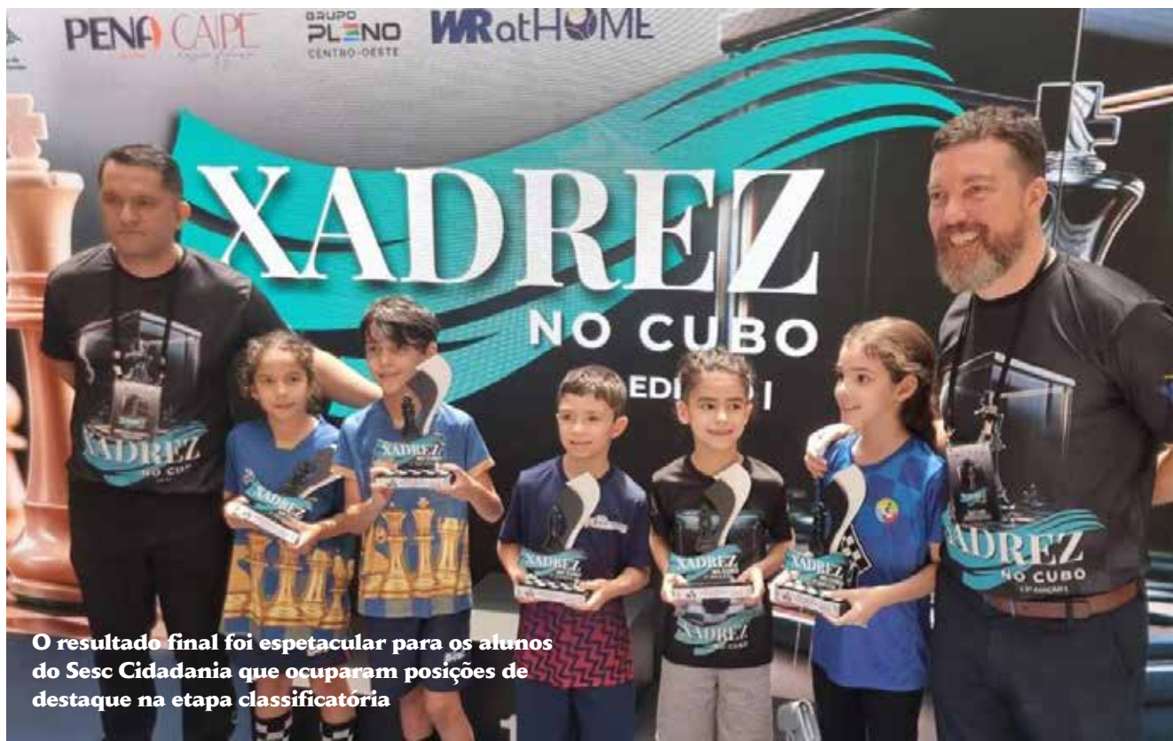
O resultado final foi espetacular para os alunos do Sesc Cidadania que ocuparam posições de destaque na etapa classificatória