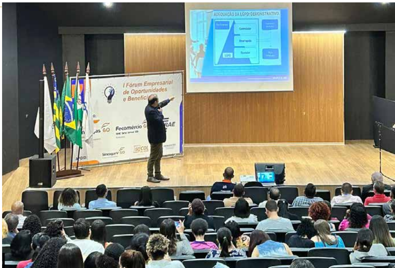
Auditório do evento do 1º Fórum Empresarial de Oportunidades e Benefícios em Rio Verde

Sucesso do fórum destaca a importância de iniciativas que promovem o fortalecimento do comércio local