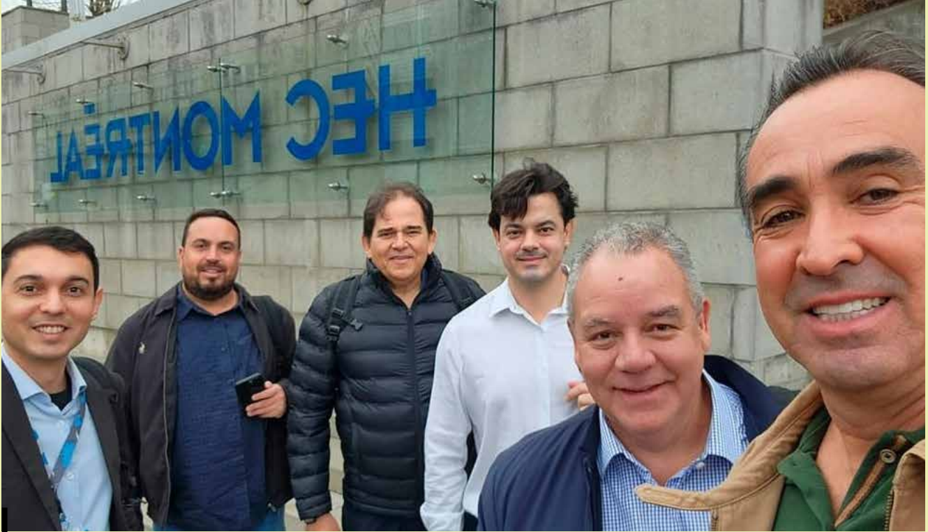
Comitiva do Sicoob Secovicred em visita ao Canadá