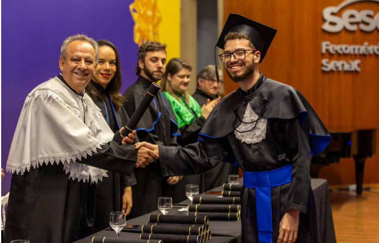
Cerimônia de colação de grau de mais de 80 alunos dos cursos de Estética e Cosmética, Análise e Desenvolvimento de Sistemas e Design Gráfico do Senac