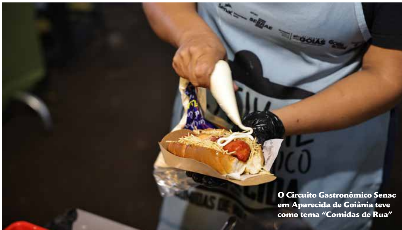
O Circuito Gastronômico Senac em Aparecida de Goiânia teve como tema “Comidas de Rua”

Com o intuito de movimentar a cidade, o evento ofereceu uma programação que uniu gastronomia, música e qualificação profissional