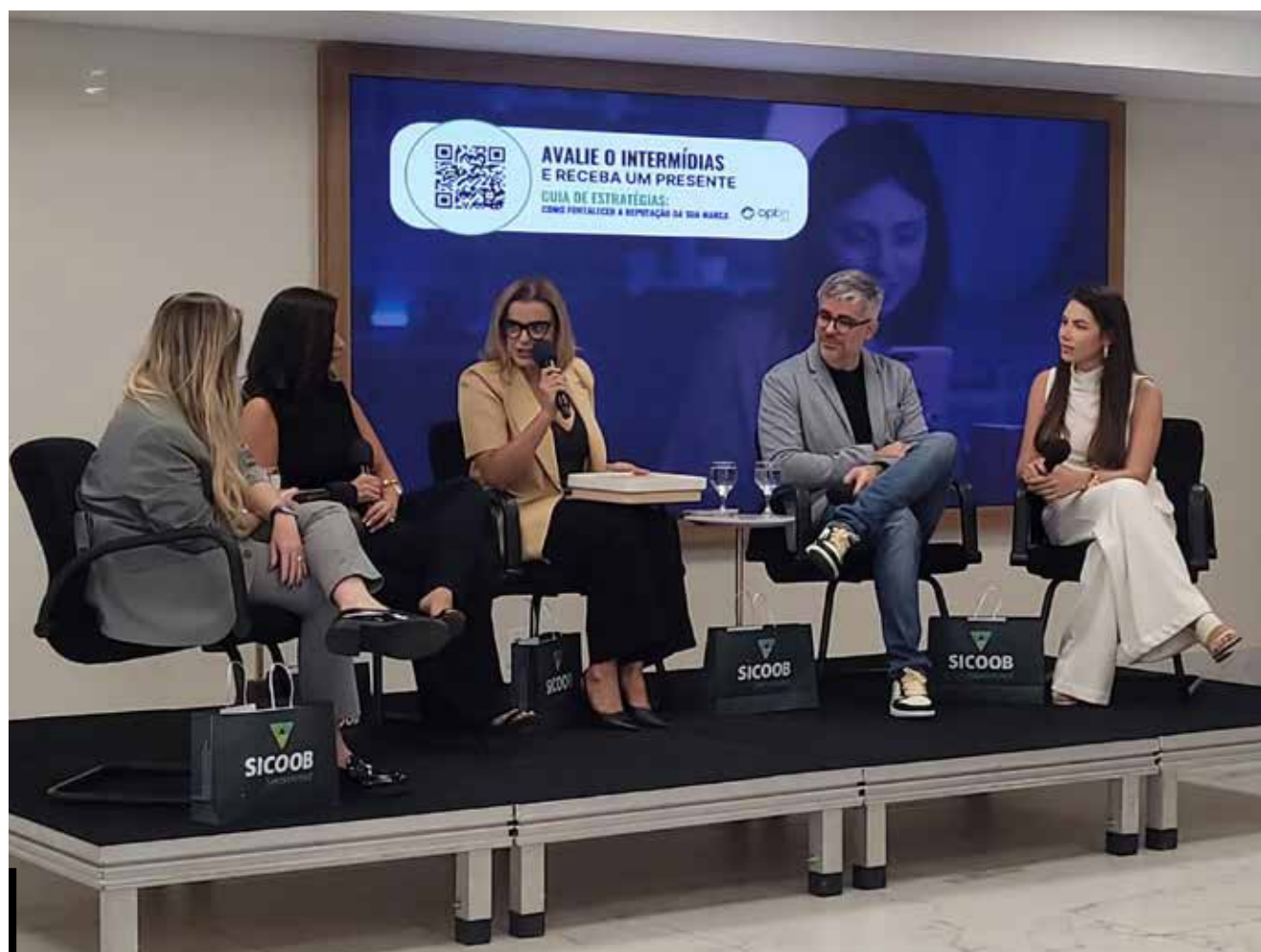
Profissionais representando grandes marcas do mercado goiano: Goiânia Shopping, Fujioka, Opus Incorporadora e Unimed Goiânia

Com a crescente digitalização dos meios de comunicação, a relevância de eventos como o Intermédias se torna cada vez mais evidente, fomentando a evolução do marketing e da publicidade no Brasil. A Fecomércio, como entidade anfitriã, reforçou seu compromisso em promover discussões relevantes para o avanço do comércio e da economia criativa.