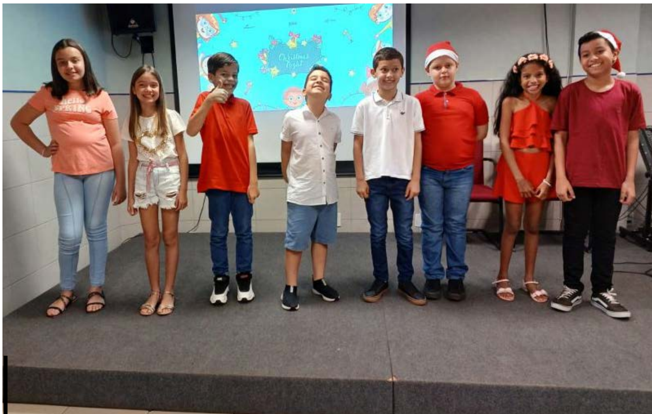
Ação foi uma forma de unir a equipe pedagógica com os alunos e seus responsáveis

Evento contou com presenças de familiares e marcou final do ano letivo