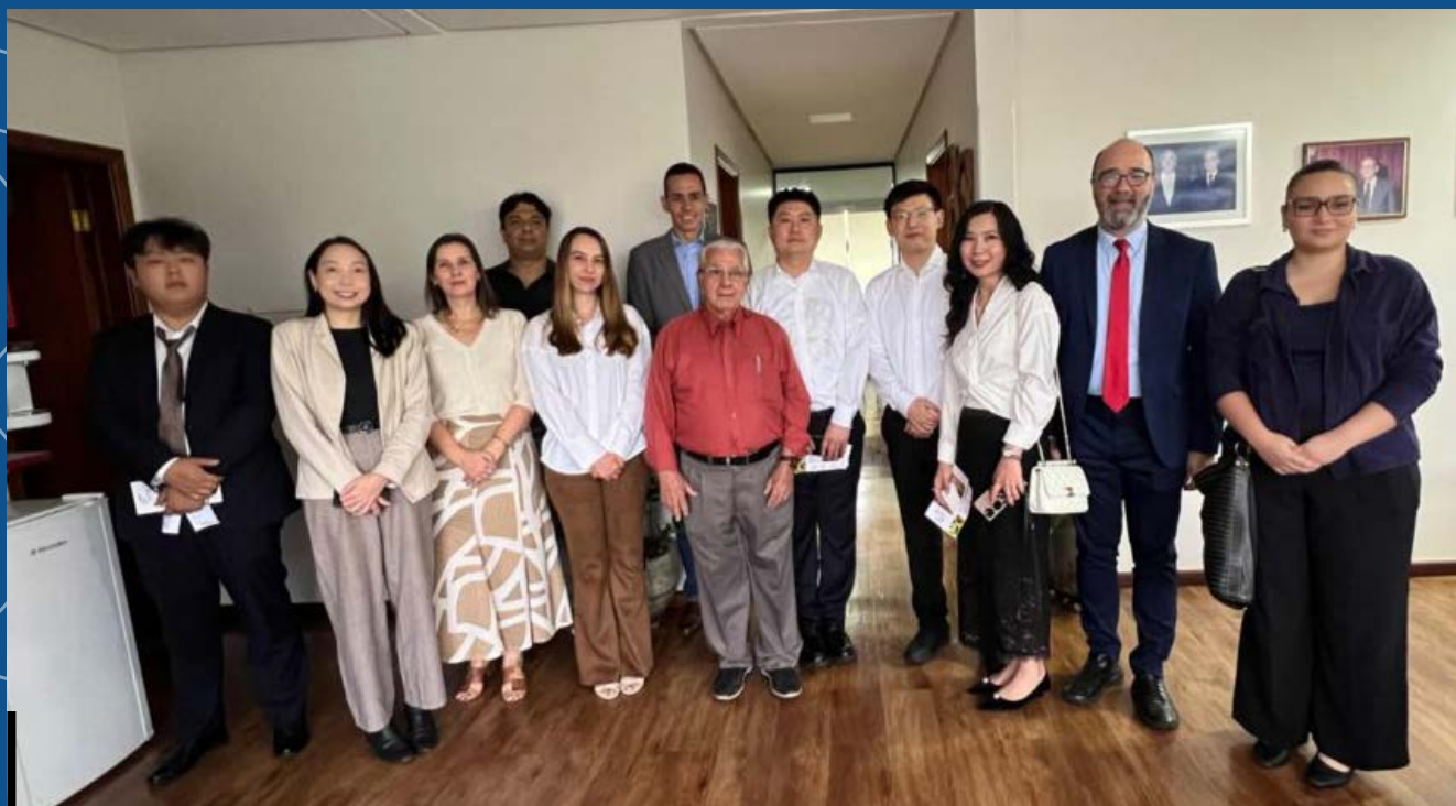
Reunião entre a Fecomex e o Sinat com os representantes da Jiangsu Yanghe Distillery Co.