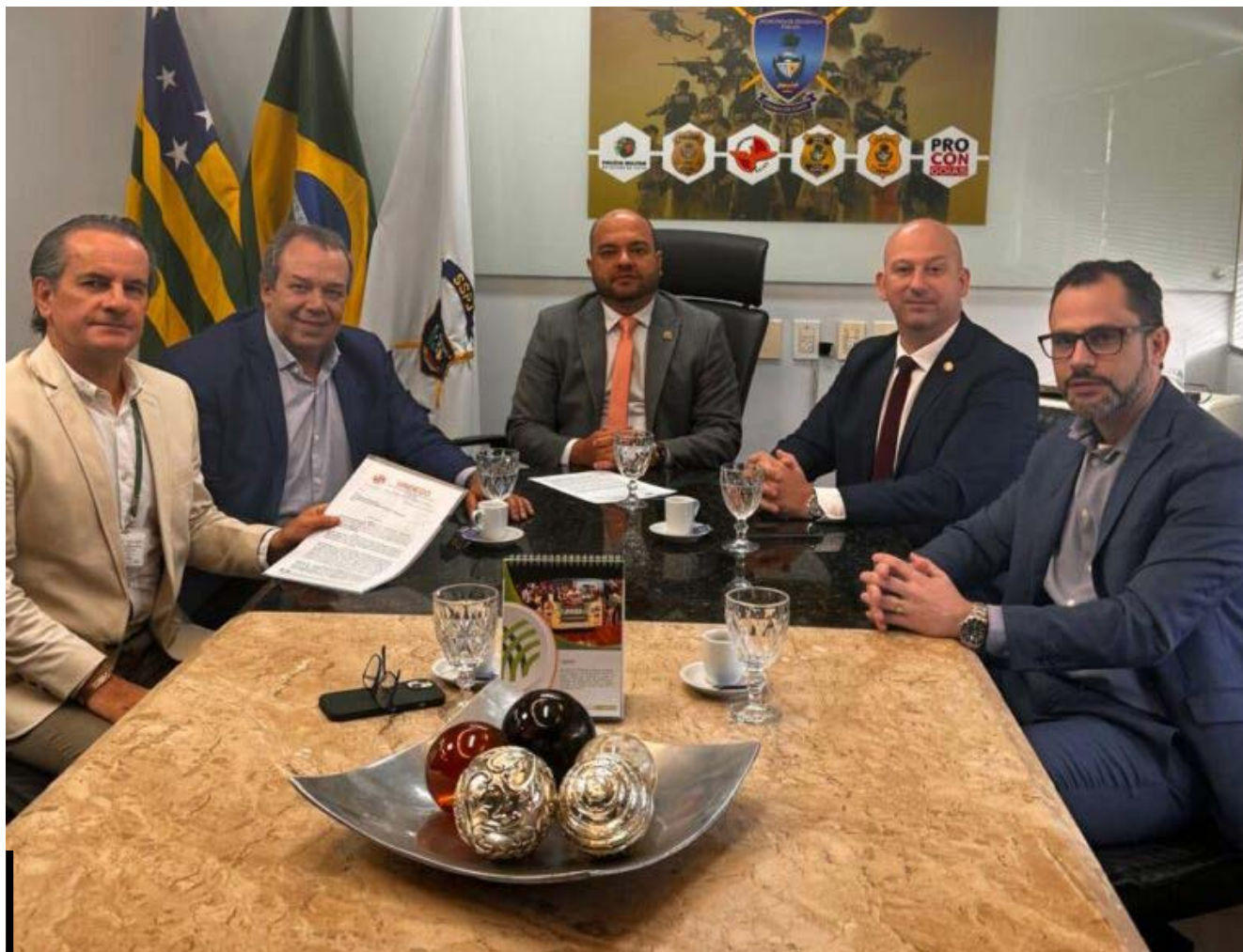
Representantes do Sindego, Fecomércio, Conselho Regional de Despachantes e da Segurança Pública Estadual

Sindego e Conselho Regional de Despachantes se reúnem com representantes da Segurança Pública Estadual