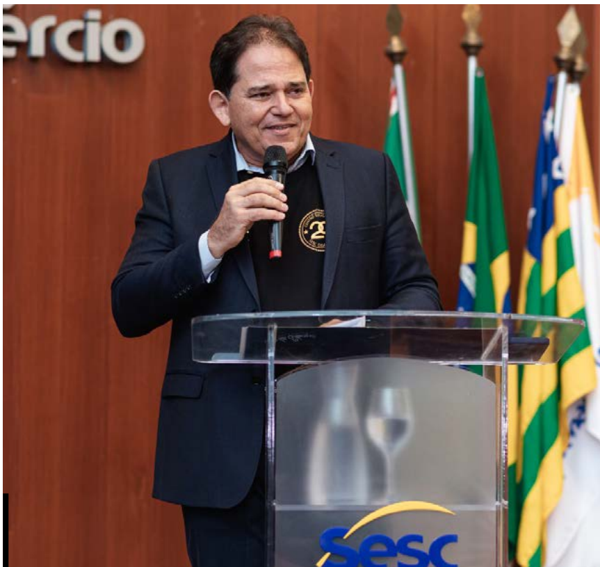
Programação especial aconteceu nos dias 26 e 27 de novembro

Programação especial reafirmou o protagonismo do Sesc Cidadania na promoção de uma educação de excelência, pautada na formação integral dos alunos e no impacto positivo na comunidade