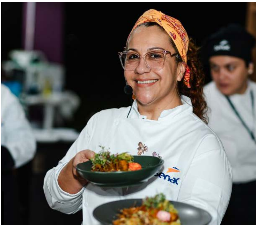
Evento teve como tema “Celebração da Gastronomia Ancestral”

Evento gratuito uniu tradição e inovação culinária, promoveu o turismo e valorizou sabores locais