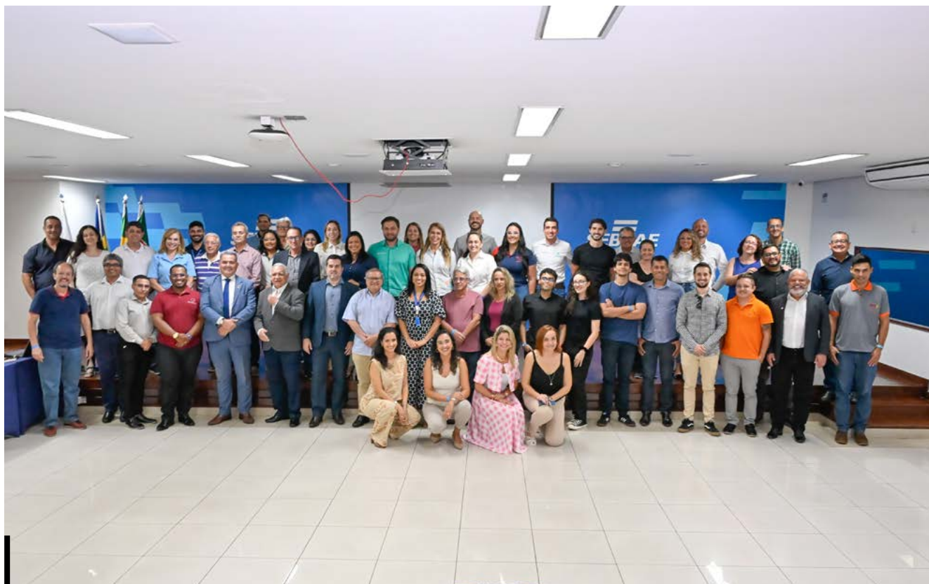
Evento contou com a presença de membros da diretoria da Federação, presidentes de sindicatos, secretários executivos e empresários