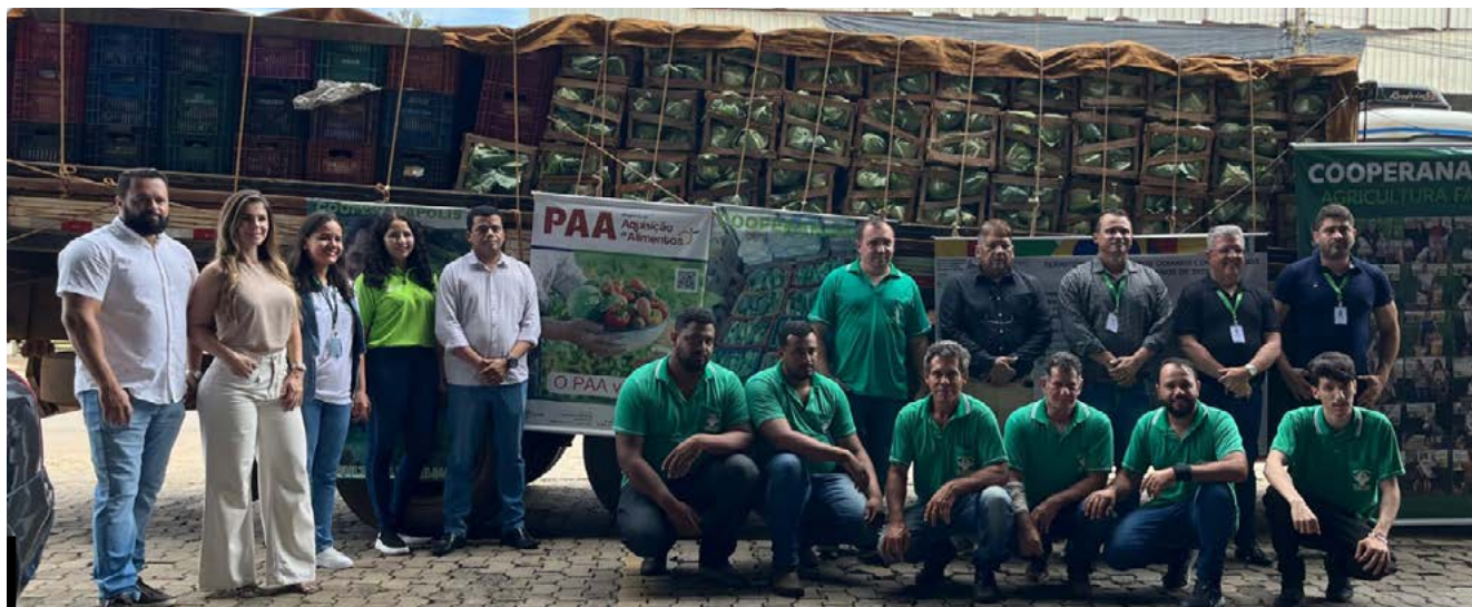
Alimentos provenientes da cooperativa de agricultores familiares de Anápolis (Cooperanápolis)

Agricultura familiar e solidariedade são os pilares de uma ação que integra o Programa de Aquisição de Alimentos